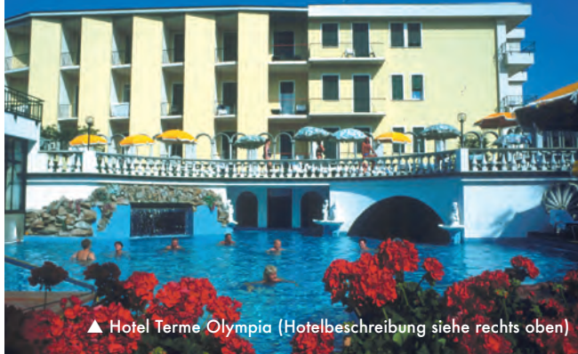
▲ Hotel Terme Olympia (Hotelbeschreibung siehe rechts oben)