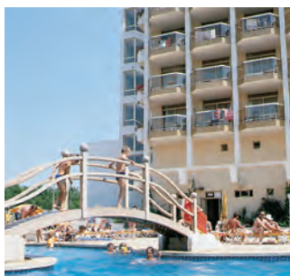
▲ Hotel Beverly Hill Park