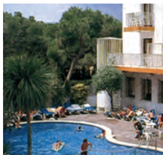
▲ Hotel Stella Maris

Kinderermäßigung (4-11 J): 1. + 2. Kind 100 % (nur Hotel) außer Saison E + F = 50 %