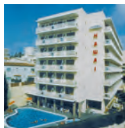
▼ Hotel Montevista

Lage: Beide Hotels liegen am Fuß des Villenberges Roca Grossa. Zum Zentrum mit vielen Unterhaltungsmöglichkeiten und dem Strand sind es ca. 400 m. Ausstattung: Die lebhaften, beim jüngeren Publikum beliebten Hotels, bieten klimatisiertes Restaurant, Salon mit Bar. Sonnenterrasse mit Liegestühlen und Sonnenschirmen. Kleine Disco-Pub im Hotel Hawaii. Hotel Montevista: Internetecke, Disco-Pub mit Billard und Sat-TV. Fitness/Unterhaltung: Swimmingpool mit Kinderbecken. Wöchentl. Unterhaltungsprogramm. Zimmer: Doppelzimmer mit 1 o. 2 Zustellbetten, renoviert und neu möbliert mit Bad o. Dusche, WC, Telefon, Mietsafe, Sat-TV, Klimaanlage, Balkon. Verpflegung: Halbpension. Alles in Buffetform, Show-Cooking.